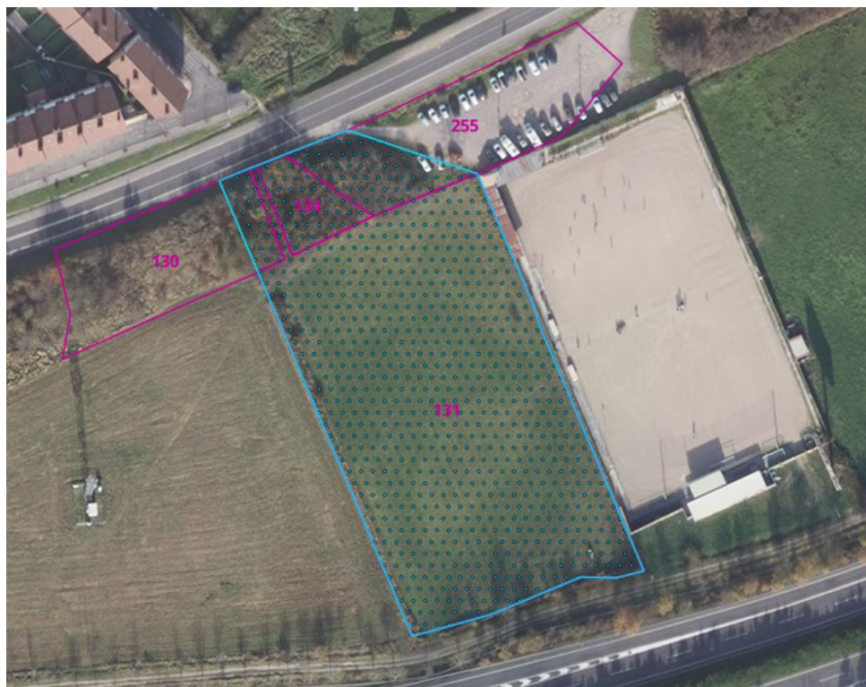
Ámbito de la modificación dentro de las parcelas catastrales 130, 131, 134 y 255 del polígono 1 de Lakuntza.